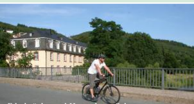
Ederbrücke und Herrenhaus Schwarzenau

Mehrere 100.000 Mitglieder zählt die „Church of the Brethren“ weltweit. Der Großteil lebt in den USA. Viele pilgern nach Schwarzenau und an die Eder. Kirchenvater Alexander Mack entwickelte im frühen 18. Jahrhundert in Schwarzenau seine baptistische Lehre und taufte 1708 die ersten Gläubigen in der Eder.